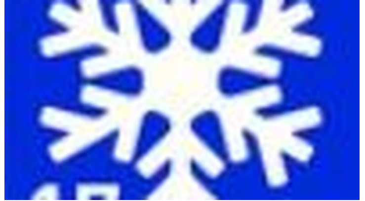
Winterwanderweg 17 Soier See Rundweg