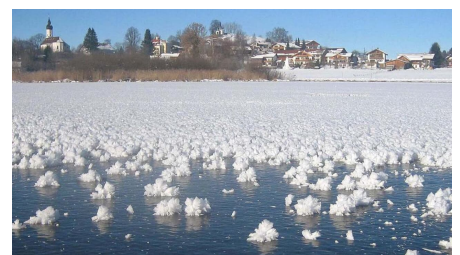
Winterwanderung - Soier See Rundweg