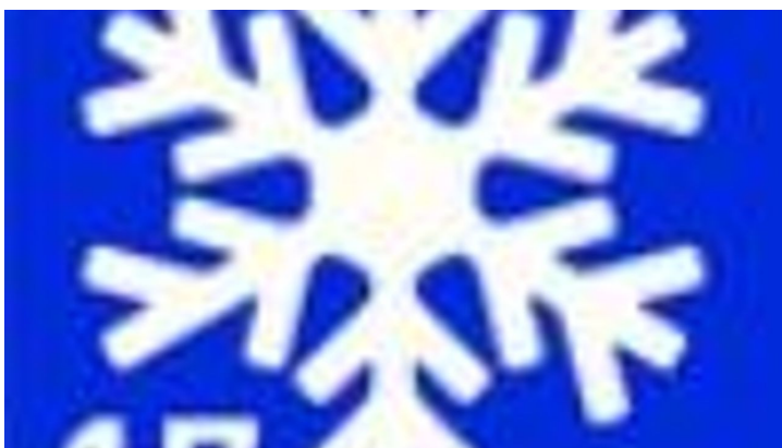
Winterwanderweg 17 Soier See Rundweg