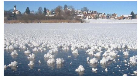
Winterwanderung - Soier See Rundweg