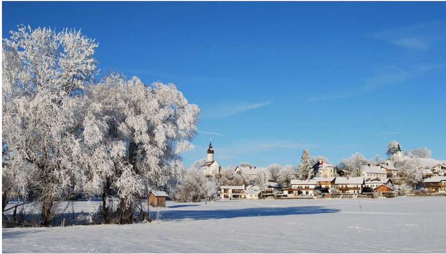
Winterwanderung - Soier See Rundweg