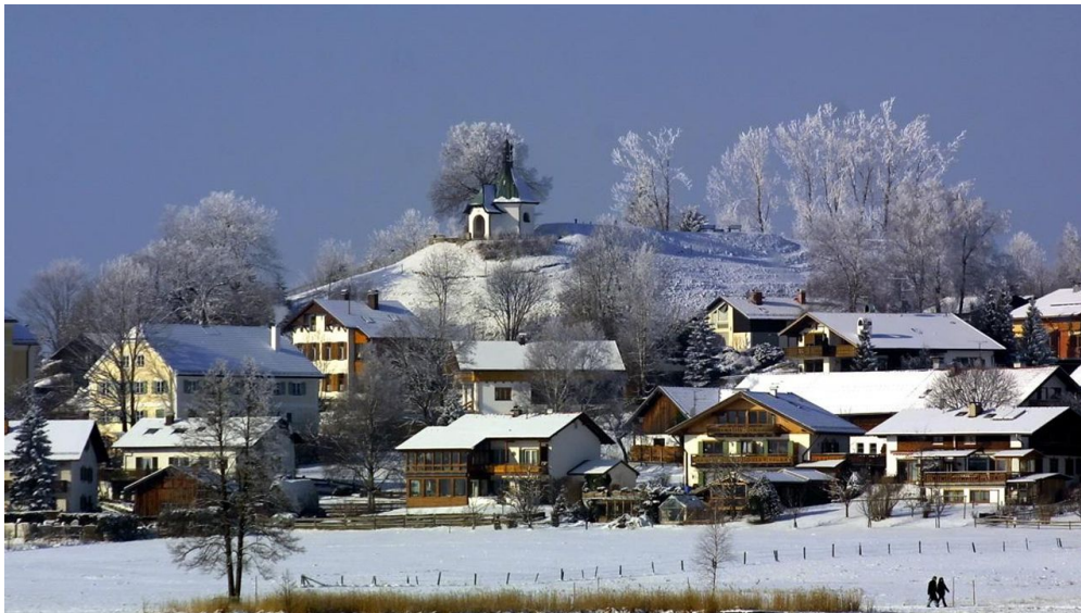
Winterwanderung - Soier See Rundweg