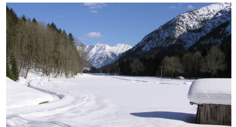
Winterwanderung Sonnenweg - Im Graswangtal