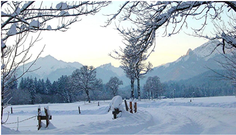
Winterwanderung Sonnenweg - Graswangtal