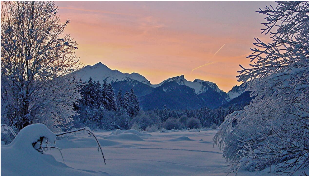
Winterwanderung Sonnenweg - Blick auf den Scheinberg

Prospektmaterial ansehen und/oder bestellen