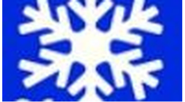
Winterwanderweg 1 Sonnenweg