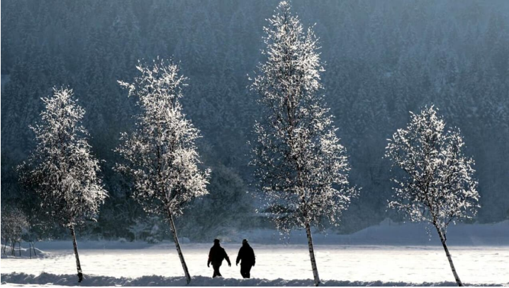
Winterwanderung Sonnenweg