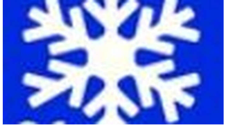
Winterwanderweg 1 Sonnenweg