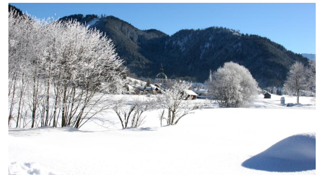
Winterwanderung Sonnenweg - Blick auf das Kloster Ettal