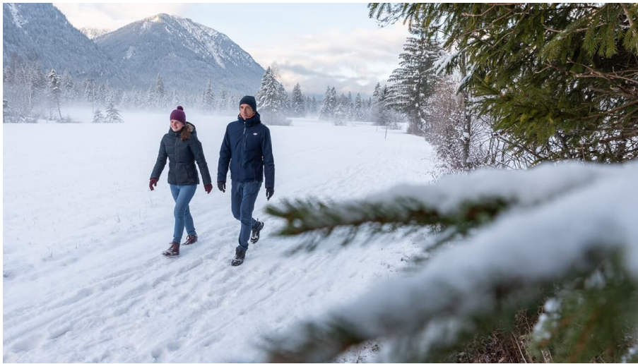
Winterwanderung Weidmoos