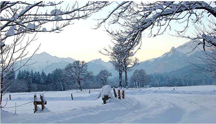
Winterwanderung - Weidmoos