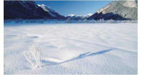
Winterwanderung - Weidmoos