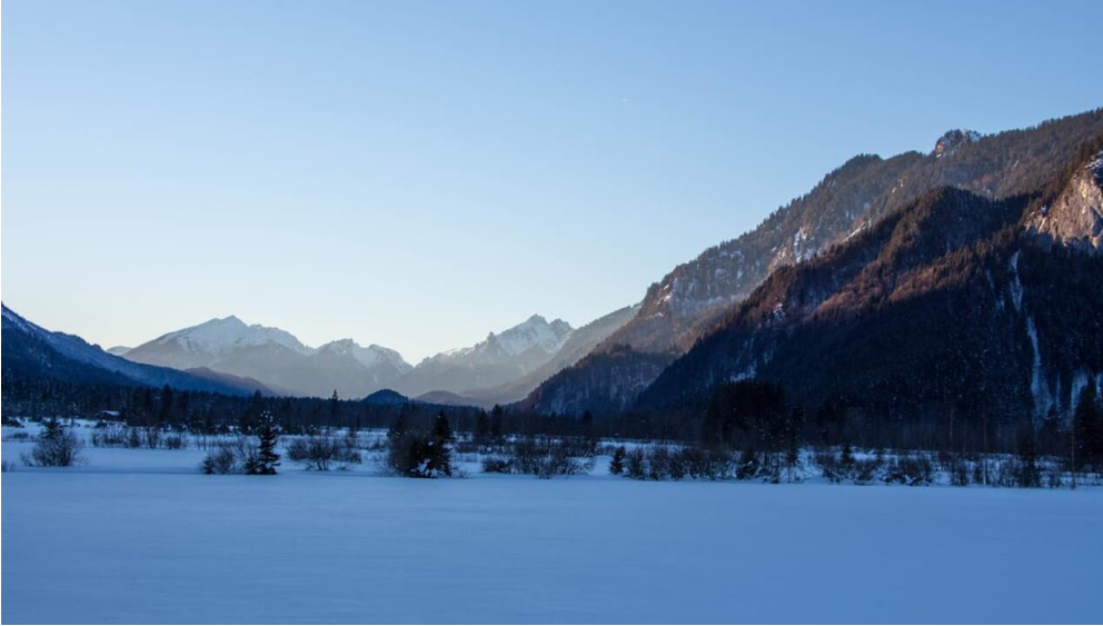
Winterwanderung - Weidmoos