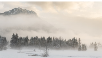
Winterwanderung Weidmoos