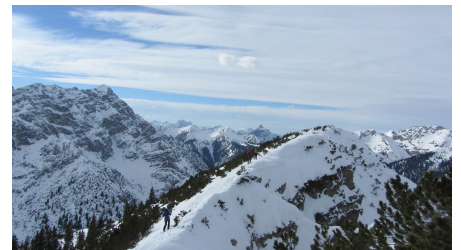
Skitour Kreuzspitze