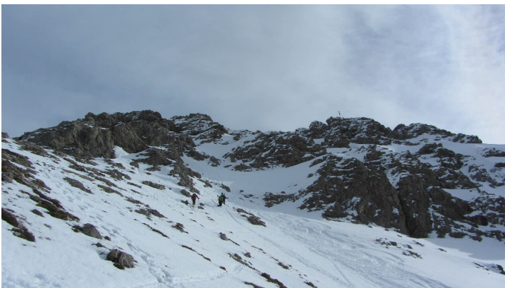
Skitour Kreuzspitze - Gipfelaufstieg - © Thorsten Unseld, Thorsten Unseld