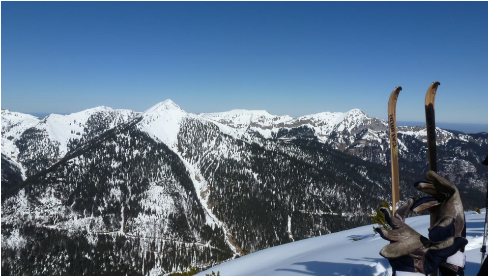
Skitour Kreuzspitze - Blick auf den Scheinberg - © Thorsten Unseld, Sebastian Heckelmiller