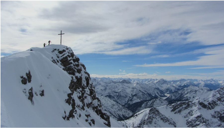
Skitour Kreuzspitze - Gipfel