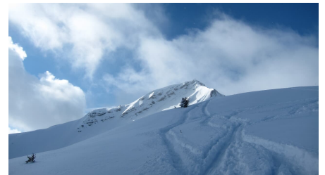
Abfahrt von der Scheinbergspitze in frischem Pulverschnee