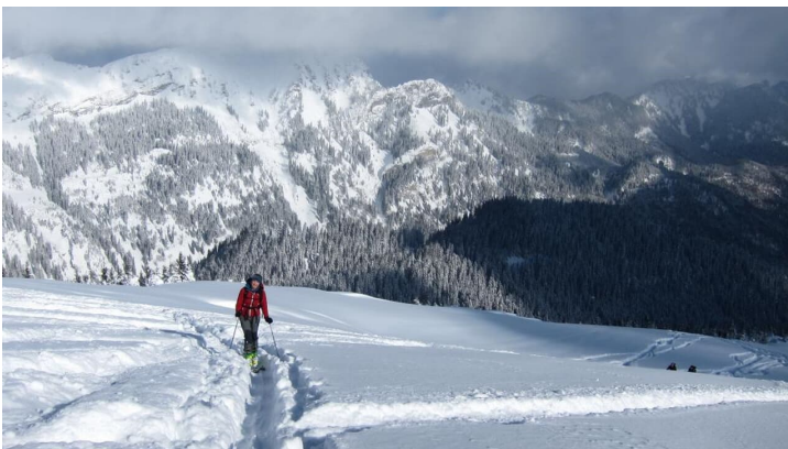
Aufstieg zur Scheinbergspitze