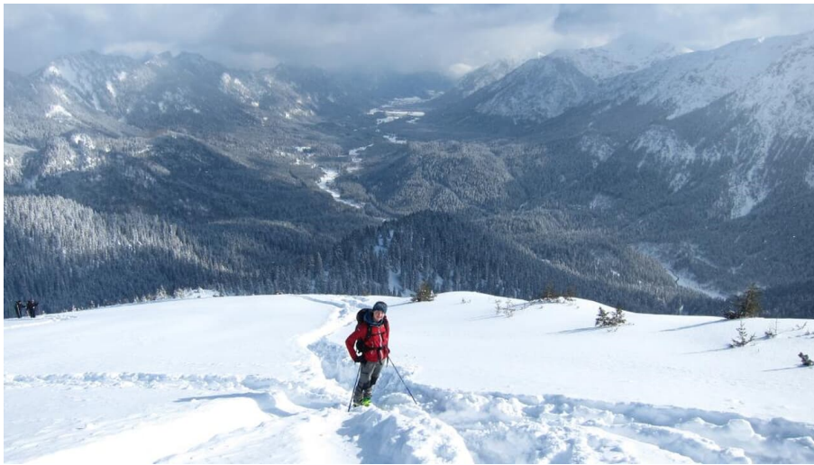
Scheinbergspitze mit Blick ins Graswangtal