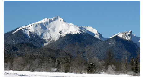
Skitour Scheinbergspitze - Scheinberg vom Graswangtal