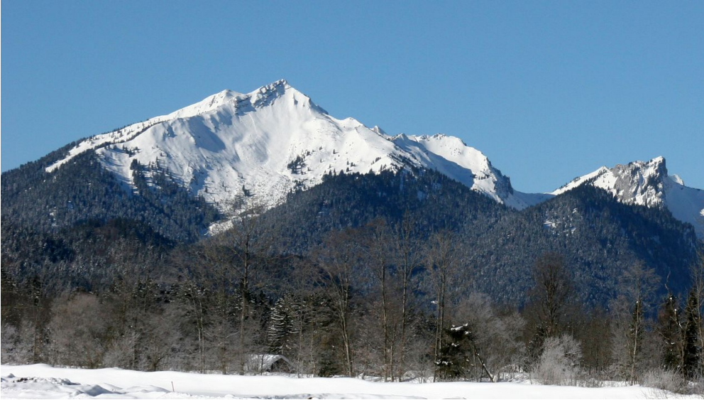
Skitour Scheinbergspitze - Scheinberg vom Graswängtal