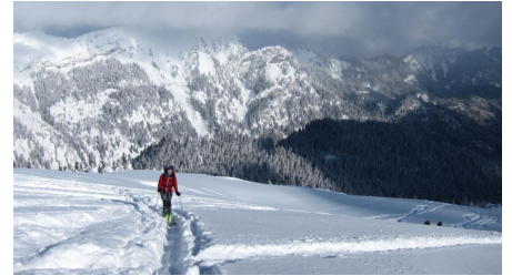
Aufstieg zur Scheinbergspitze