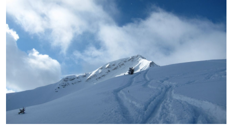
Abfahrt von der Scheinbergspitze in frischem Pulverschnee