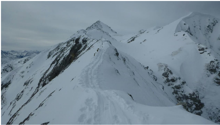
Hochplatte - Vorgipfel, 26.2.2017