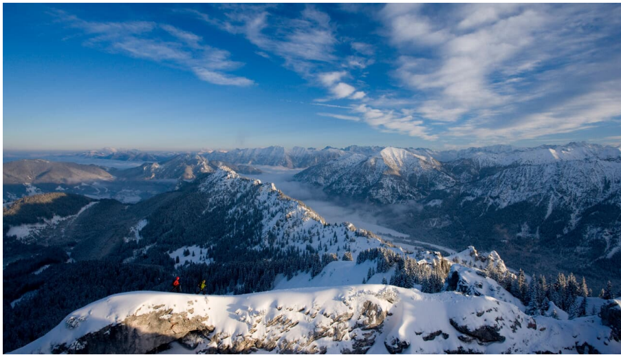
Skitour Teufelstättkopf