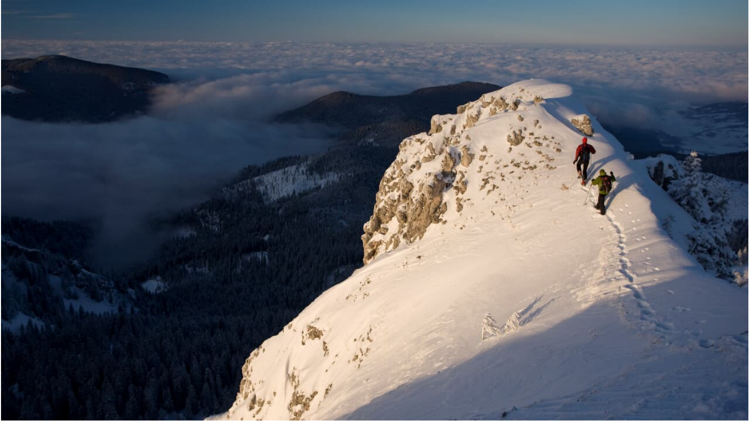
Skitour Teufelstättkopf