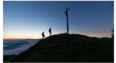
Meditationsweg Ammergauer Alpen