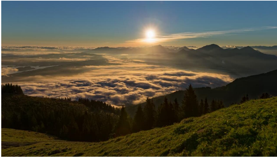
Meditationsweg Ammergauer Alpen - am hinteren Hörnle