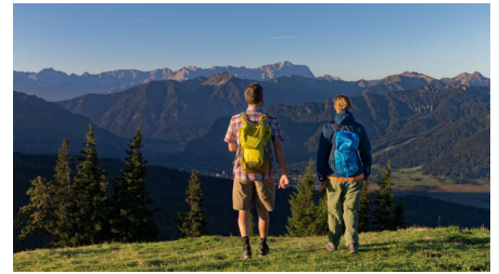
Meditationsweg Ammergauer Alpen - am vorderen Hörnle - © Thorsten Unseld, Anton Brey