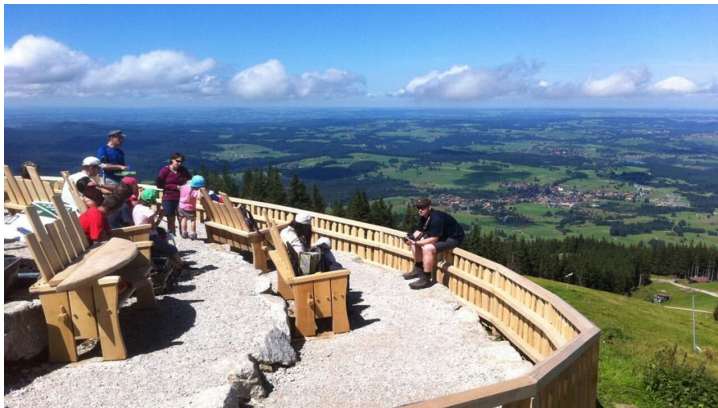
Fernwanderweg Meditationsweg Ammergauer Alpen - Zeitberggipfel am Hörnle - © Thorsten Unseld, Ammergauer Alpen GmbH