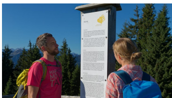
Meditationsweg Ammergauer Alpen - am mittleren Hörnle