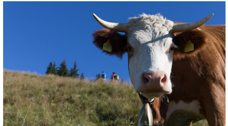
Meditationsweg Ammergauer Alpen - am vorderen Hörnle