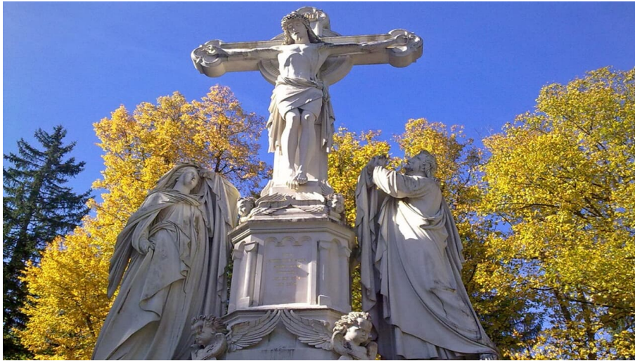
Fernwanderweg Meditationsweg Ammergauer Alpen - Kreuzigungsgruppe