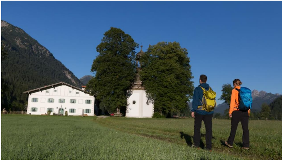
Meditationsweg Ammergauer Alpen - an der Gertrudiskapelle - © Thorsten Unseld, Anton Brey