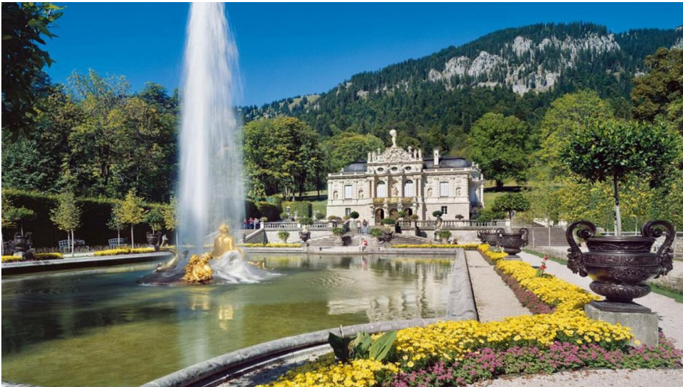
Meditationsweg Ammergauer Alpen (AA): 14. Etappe - Gertrudiskapelle - Schloss Linderhof - © Thorsten Unsel, Bayerische Schlösserverwaltung

Prospektmaterial ansehen und/oder bestellen