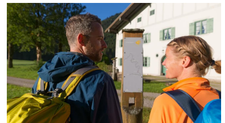
Meditationsweg Ammergauer Alpen - an der Gertrudiskapelle