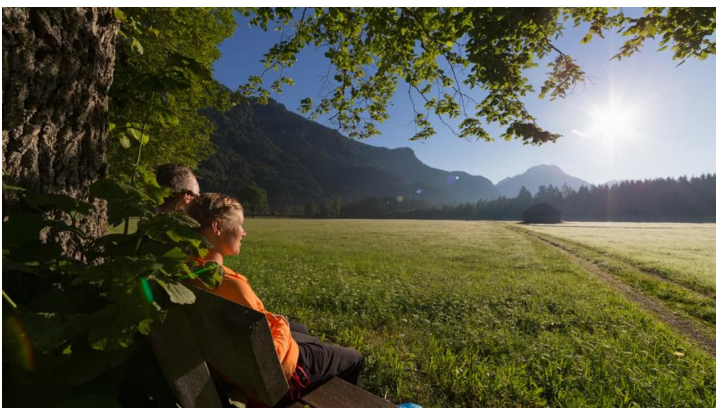
Meditationsweg Ammergauer Alpen - an der Gertrudiskapelle