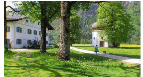
Meditationsweg Ammergauer Alpen (AA): 14. Etappe - Gertrudiskapelle - Schloss Linderhof - © Thorsten Unsel, Manfred Müller