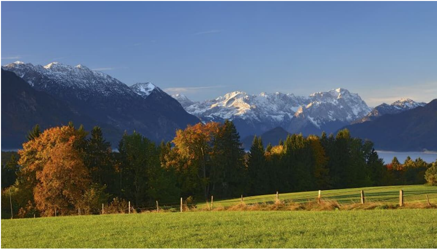
Wanderung - Guglhör-Rundweg - Das Wettersteingebirge