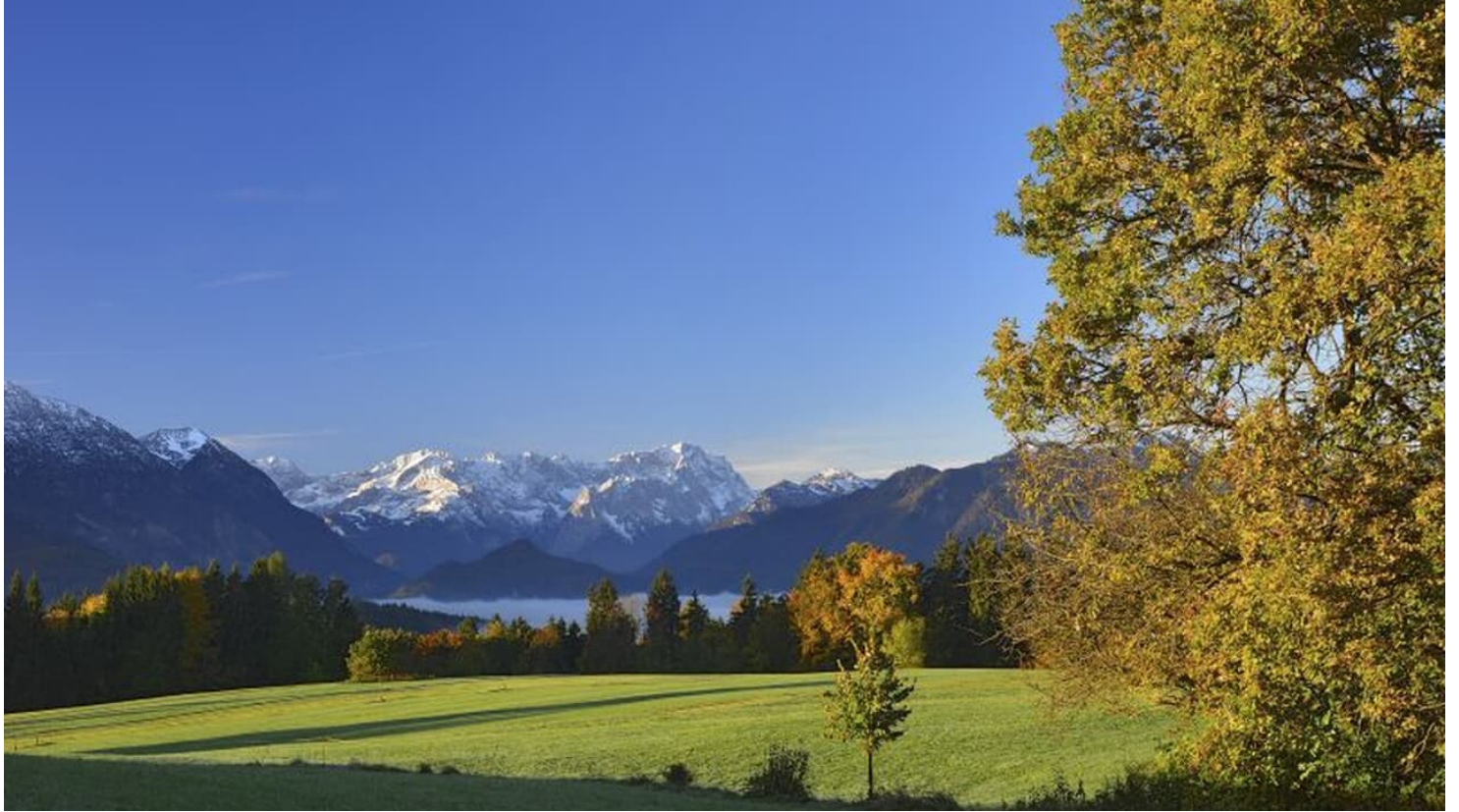
Wanderung - Guglhör-Rundweg - Blick Richtung Zugspitze