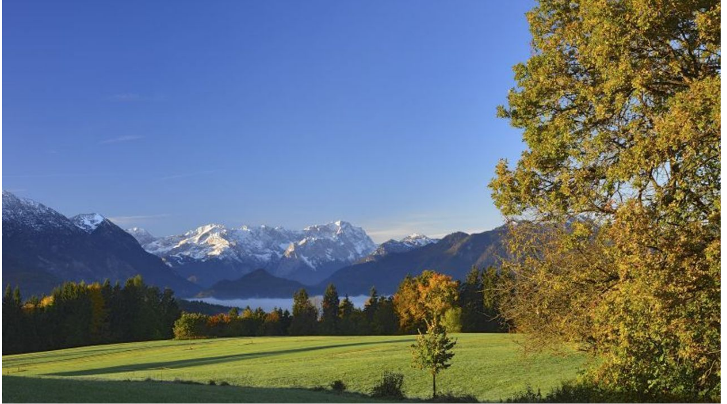
Wanderung - Guglhör-Rundweg - Blick Richtung Zugspitze