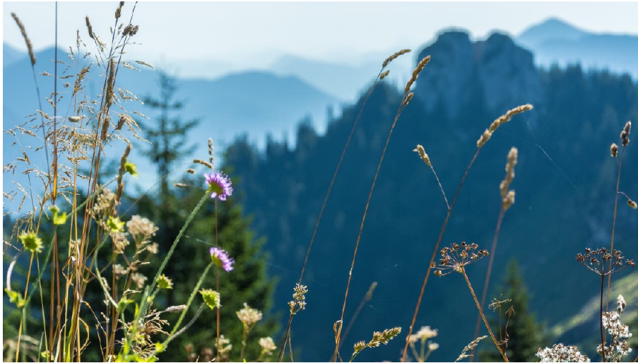
Ettaler Mandl