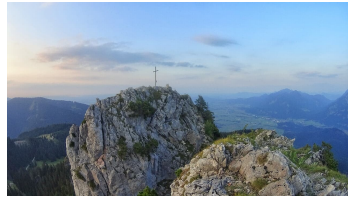
Blick Richtung Norden Ettaler Mandl