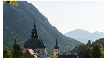
Blick auf Kloster Ettal