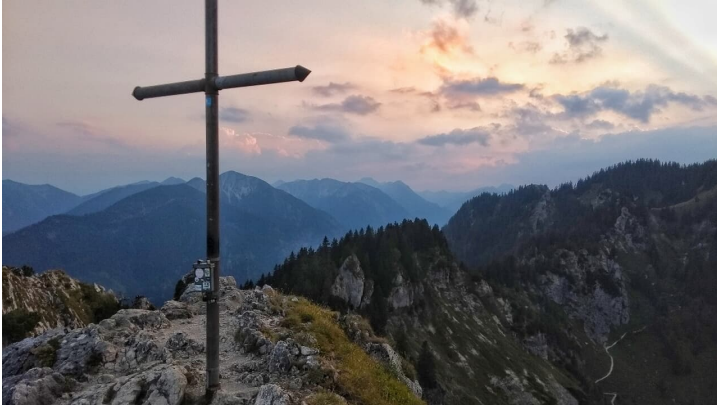
Gipfelkreuz Ettaler Mandl