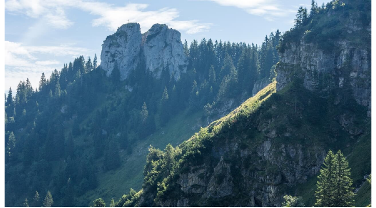
Blick auf Ettaler Mandl