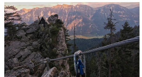
Klettersteig Ettaler Manndl