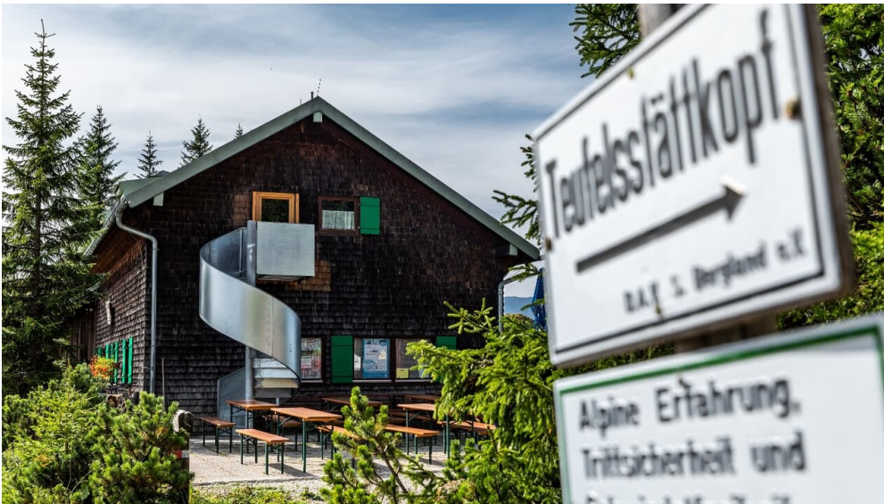
August-Schuster-Haus - © Erika Spengler, Zugspitz Region GmbH

Prospektmaterial ansehen und/oder bestellen