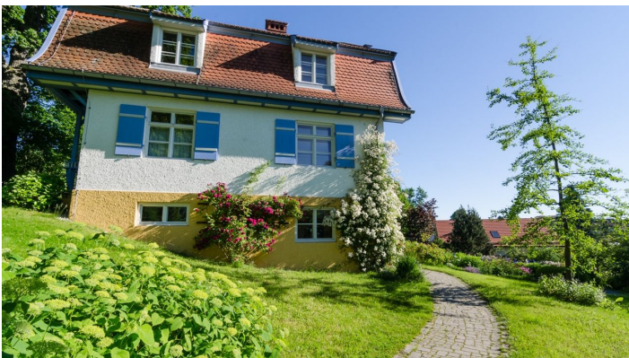
Das Münter Haus