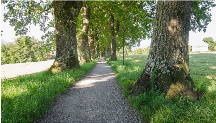
Die Kottmüller-Allee bei Murnau