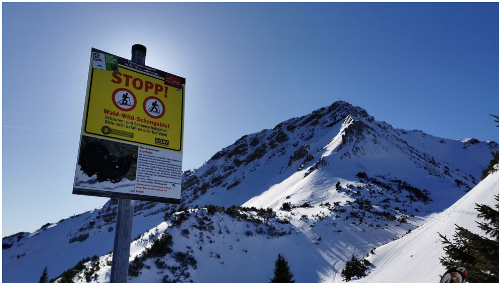
Stopp Schild Scheinberg