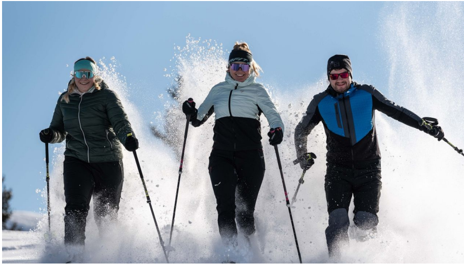
Spaß im Schnee