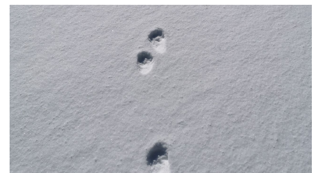
Spuren im Schnee Scheinberg