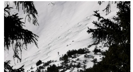
Tour Scheinberg