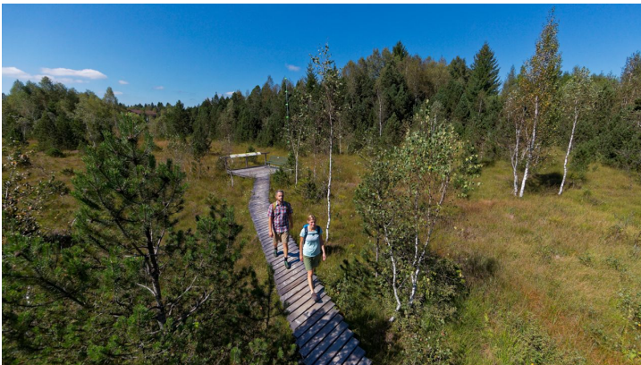
Moorlehrpfad Bad Bayersoien - © Thorsten Unsel, Anton Brey, Anton Brey Anton Brey - Photography