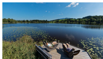
Moorlehrpfad Bad Bayersoien