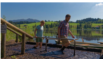
Moortretbecken - Moorlehrpfad Bad Bayersoien