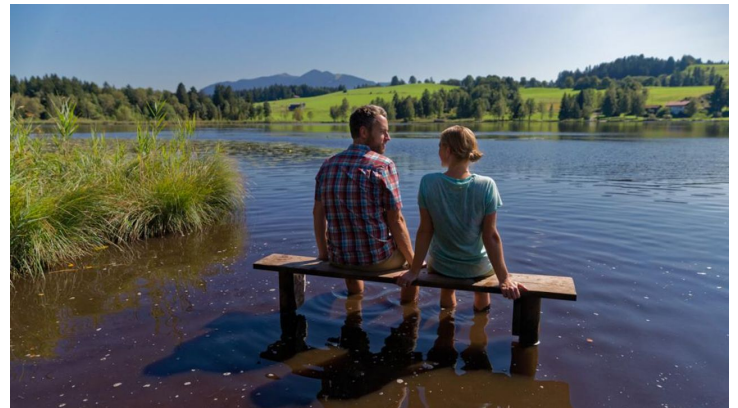
Moorlehrpfad Bad Bayersoien - © Thorsten Unsel, Anton Brey