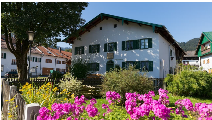
Dormuseum in Unterammergau