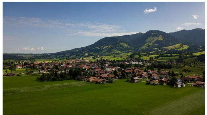
Unterammergau aus der Vogelperspektive