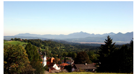
Blick über Bad Kohlgrub Richtung Murnauer Moos