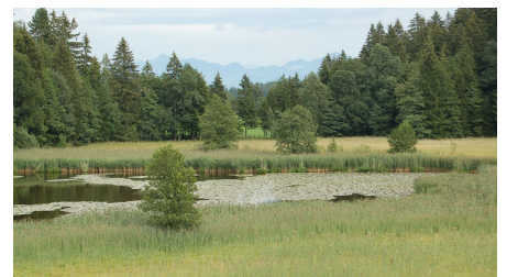
Der Rantscher Weiher