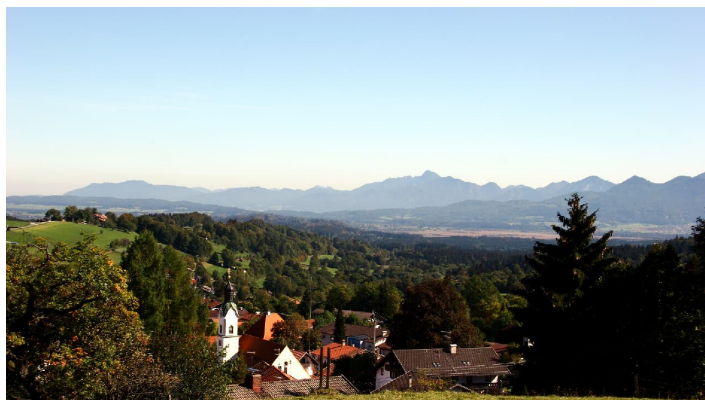
Blick über Bad Kohlgrub Richtung Murnauer Moos