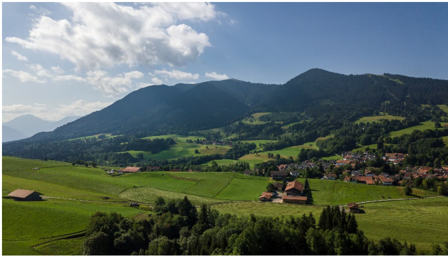
Bad Kohlgrub aus der Luft