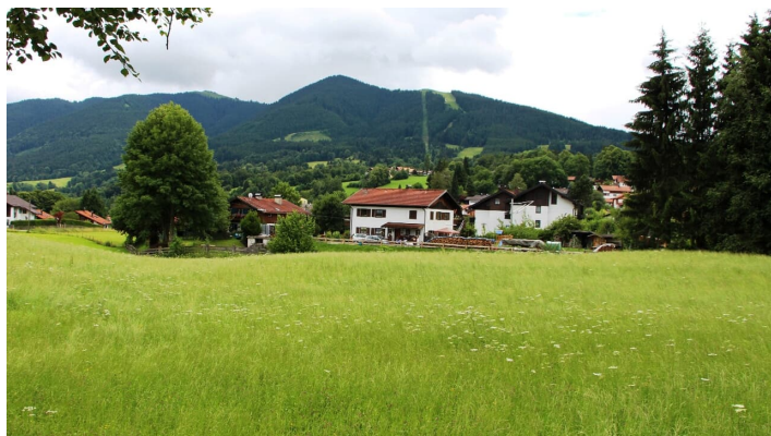
Wiesen in Bad Kohlgrub

Prospektmaterial ansehen und/oder bestellen