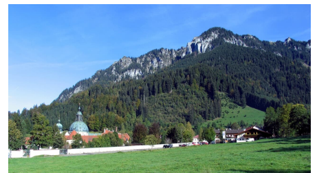
Bergtour Ettaler Manndl - Blick auf Kloster Ettal und Läber