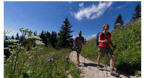
Bergtour - Ettaler Manndl