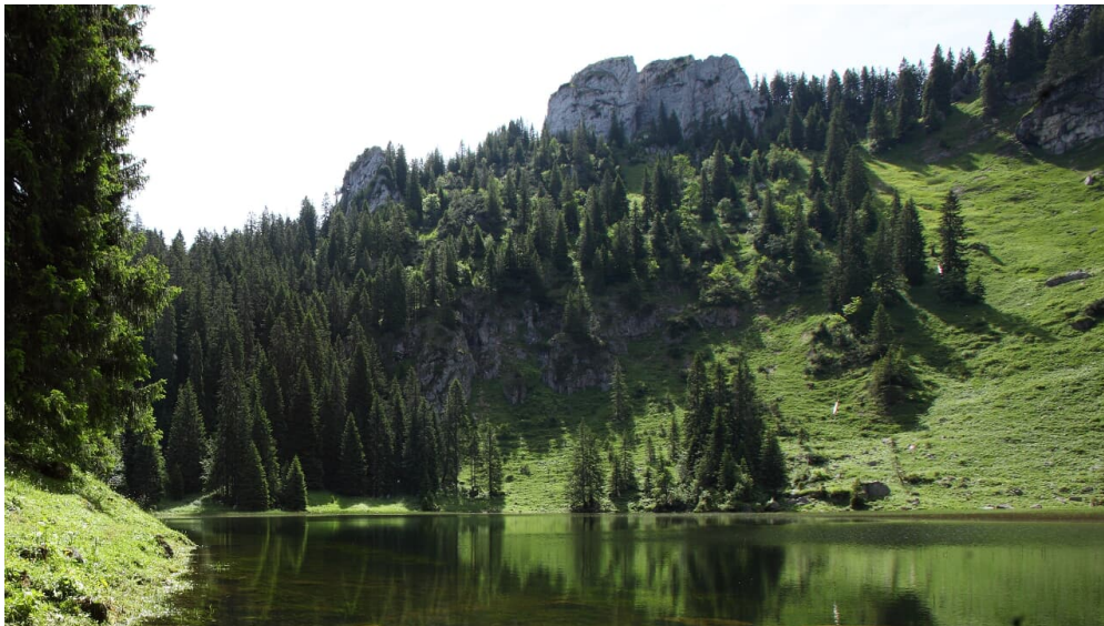
Bergtour Ettaler Manndl - Blick auf Solia See