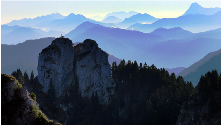
Bergtour Ettaler Mandl - Gipfel mit Estergebirge und Fernblick bis zum Wilden Kaiser