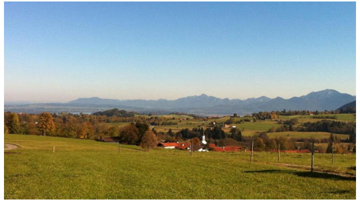
Wanderung - Gemütliche Voralpenwanderung