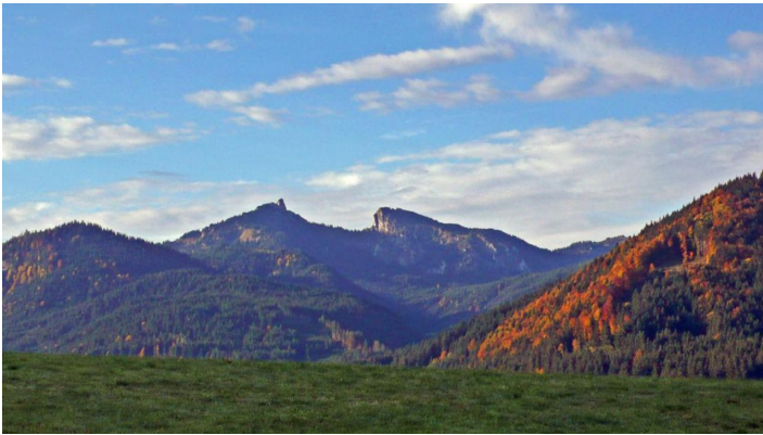
Wanderung - Gemütliche Voralpenwanderung

Prospektmaterial ansehen und/oder bestellen