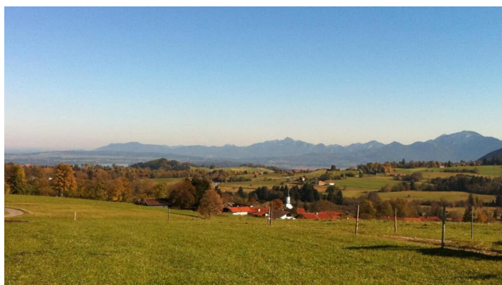
Wanderung - Gemütliche Voralpenwanderung