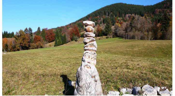
Wanderung Ammergauer Wiesmahdweg