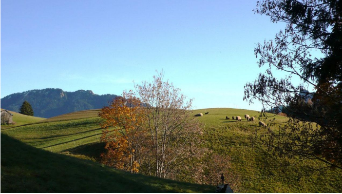
Wanderung Ammergauer Wiesmahdweg