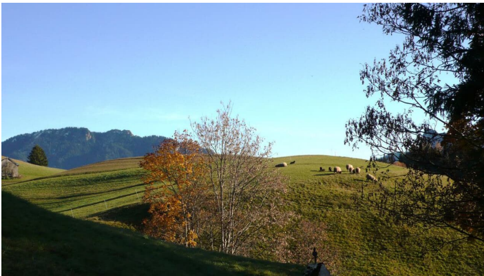
Wanderung Ammergau Wiesmahdweg