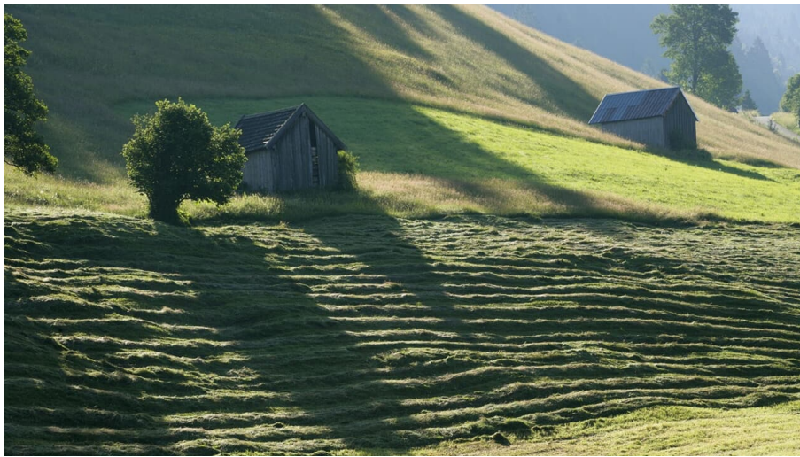
Wanderung - Ammergauer Wiesmahdweg