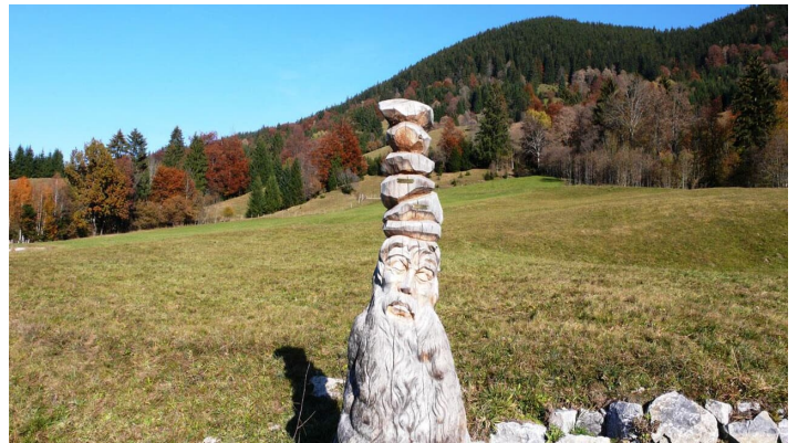
Wanderung Ammergau Wiesmahdweg