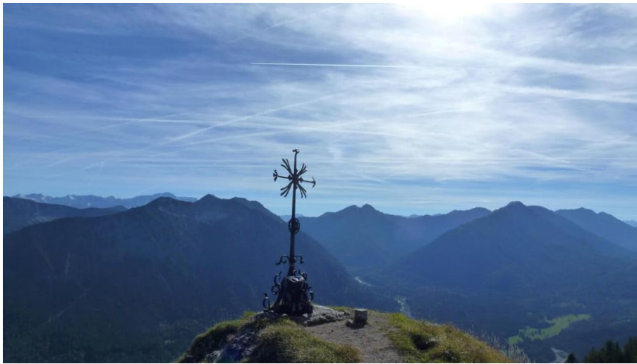
Bergtour - Teufelstättkopf, Sonnenberg und Kofel - Gipfelkreuz Sonnenberg