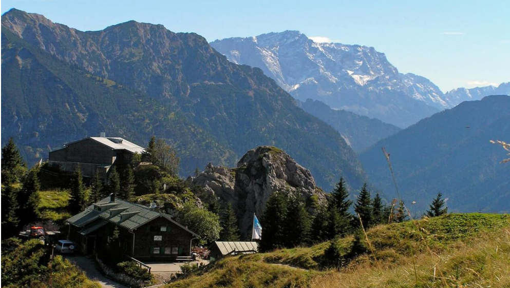
Ammergauer Höhenweg (1.Etappe von 4)