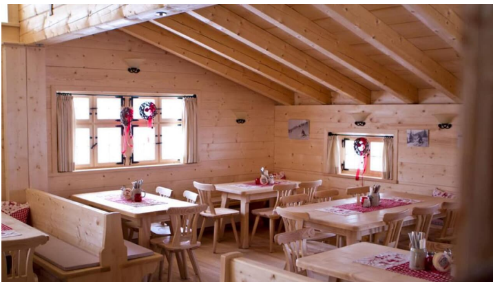
Bergtour - Teufelstättkopf, Sonnenberg und Kofel - Kolbensattelhütte