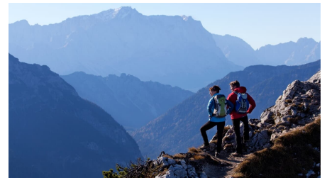
Bergtour Teufelstättkopf Sonnenberg und Kofel - Blick auf Zugspitze und Wetterstein