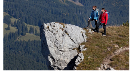
Bergtour Teufelstättkopf Sonnenberg und Kofel - Am Teufelstättkopf