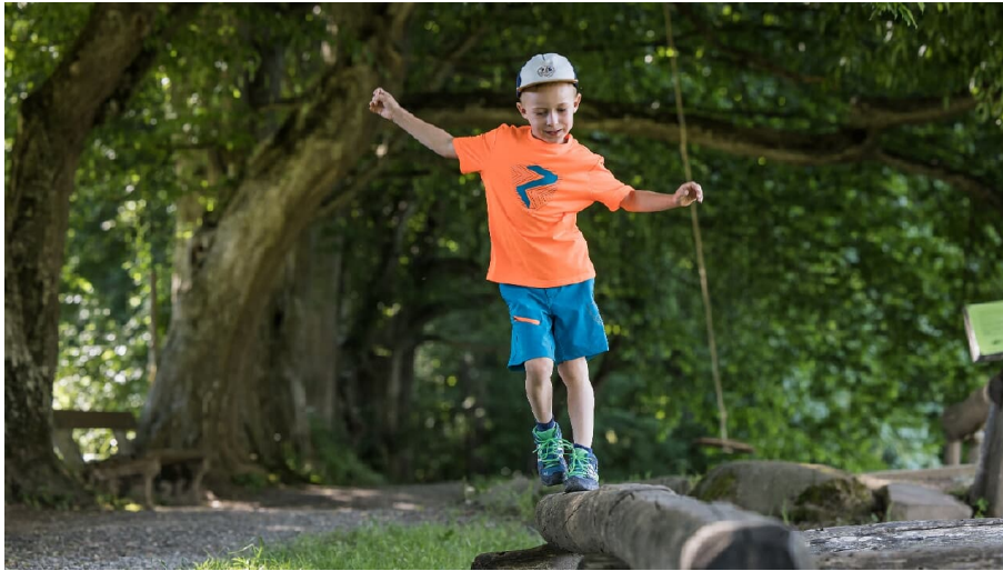
Ballansieren auf der Schluchten Erlebnisrunde