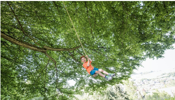
Schluchten Erlebnisrunde in Bad Kohlgrub