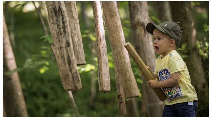
Spielen in Bad Kohlgrub - © Hansi Heckmair, Ammergauer Alpen GmbH