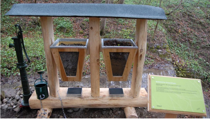
Themenweg - Mythenweg - Timberland Trail - Köhlerweg