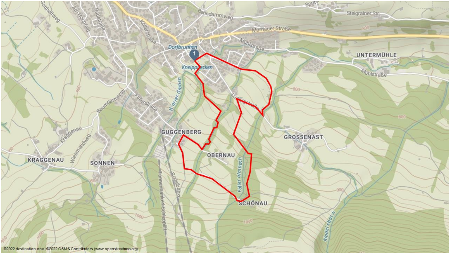
©2022 destination one | ©2022 OSM & Contributors (www.openstreetmap.org)