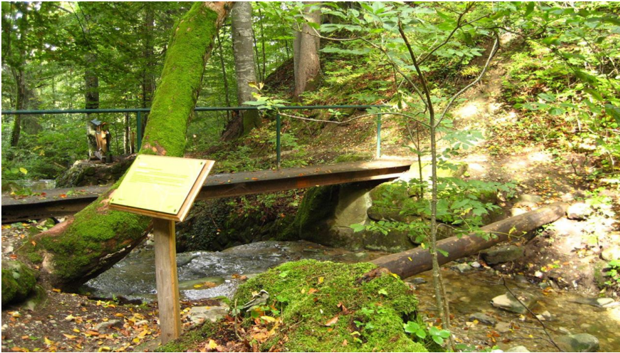
Themenweg - Mythenweg - Timberland Trail - Köhlerweg