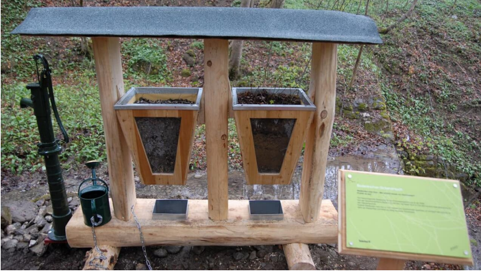
Themenweg - Mythenweg - Timberland Trail - Köhlerweg - © Thorsten Unsel, Naturpark Ammergauer Alpen