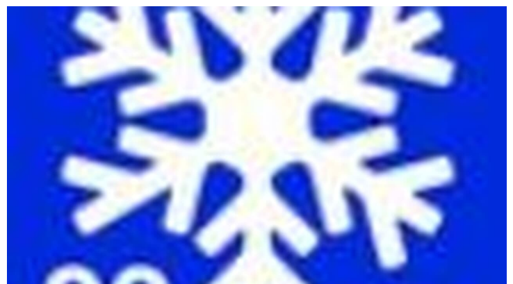
Winterwanderweg 2 Enzianweg