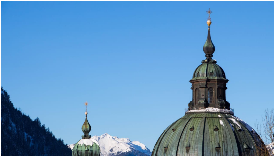
Winterwanderung - Enzianweg