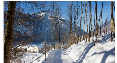
Winterwanderung - Enzianweg