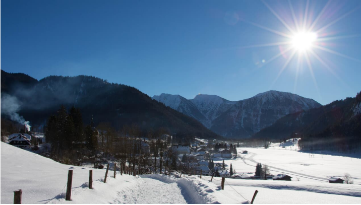
Winterwanderung - Enzianweg - © Thorsten Unseld, Ammergauer Alpen GmbH