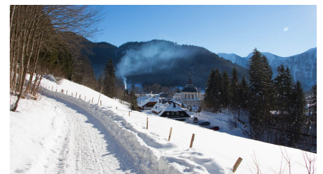
Winterwanderung - Enzianweg