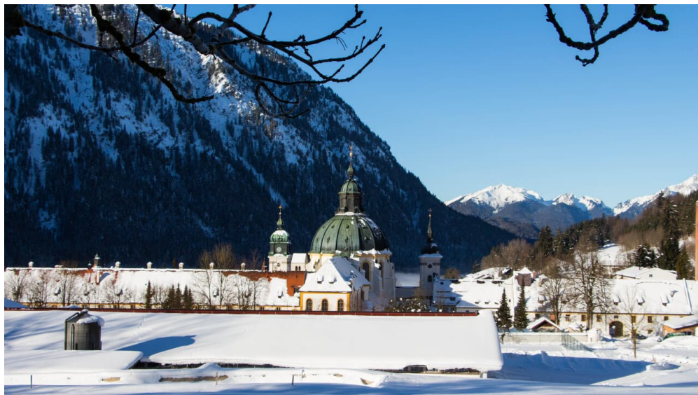
Winterwanderung - Enzianweg