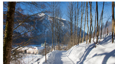
Winterwanderung - Enzianweg