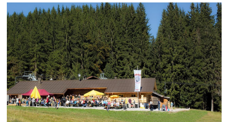
Wanderung - Kolbensattelhütte - Sonnenterrasse