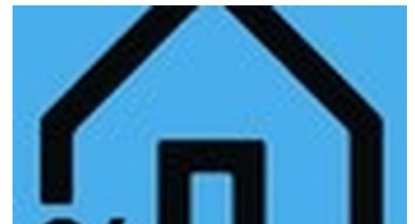
Hüttenwanderung Kolbensattelhütte