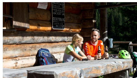
Mountainbiketour - Soila-Alm - Rast an der Alm - © Thorsten Unseld, Anton Brey