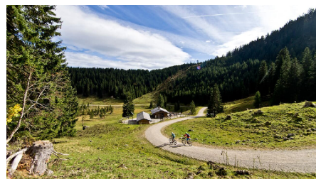
Mountainbiketour - Soila-Alm