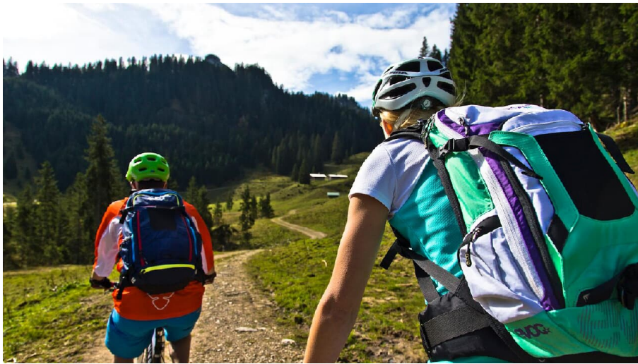
Mountainbiketour - Soila-Alm