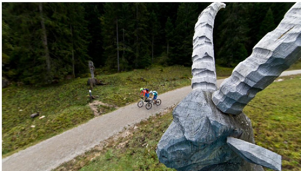
Mountainbiketour - Soila-Alm

Prospektmaterial ansehen und/oder bestellen