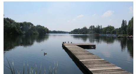
Südsee, Braunschweig