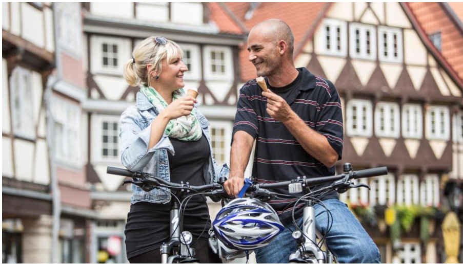
Echt verdient!