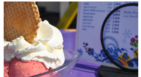
EisZeit in Salzdahlum - © Jessica Lau, NHaVo/Christin Laubender