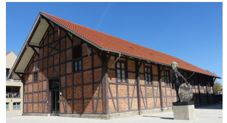
Bürger Museum Wolfenbüttel