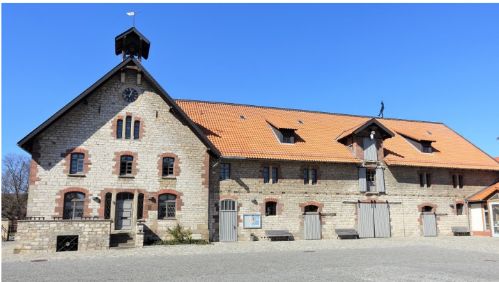
Städtisches Museum Salzgitter-Salder