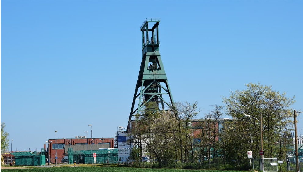
Schacht Konrad - © Thomas Kempfer, Elm-Freizeit, Allianz für die Region GmbH