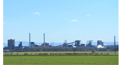
Blick auf die Stahlwerke Salzgitter