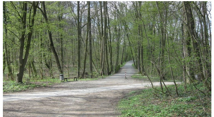
Terrainkurweg 2 Salzgitter-Bad, Hasenspringroute