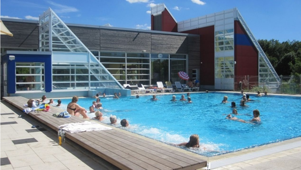
Außenansicht Thermalbad Salzgitter-Bad