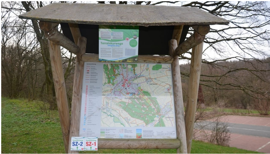
Übersichtstafel Terrainkurwege in Salzgitter-Bad