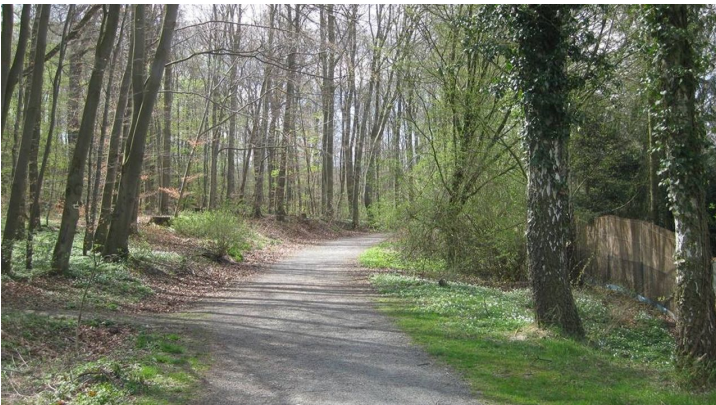
Terrainkurweg 2 Salzgitter-Bad, Hasenspringroute