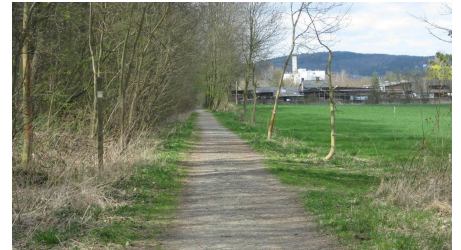
Terrainkurweg 2 Salzgitter-Bad, Hasenspringroute