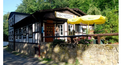
Waldgaststätte Hasenspring