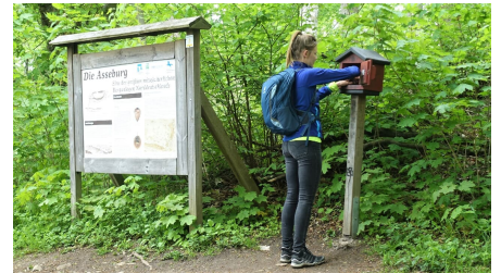
Stempelstelle 2 Asseburg