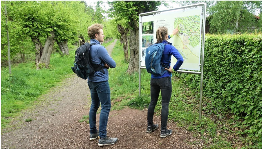
Infotafel Liebesallee