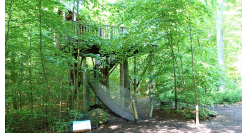
12 Löwe-Turm und Bohlenweg