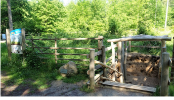
06 Station 2 - Bodenprofil