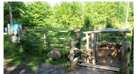
06 Station 2 - Bodenprofil