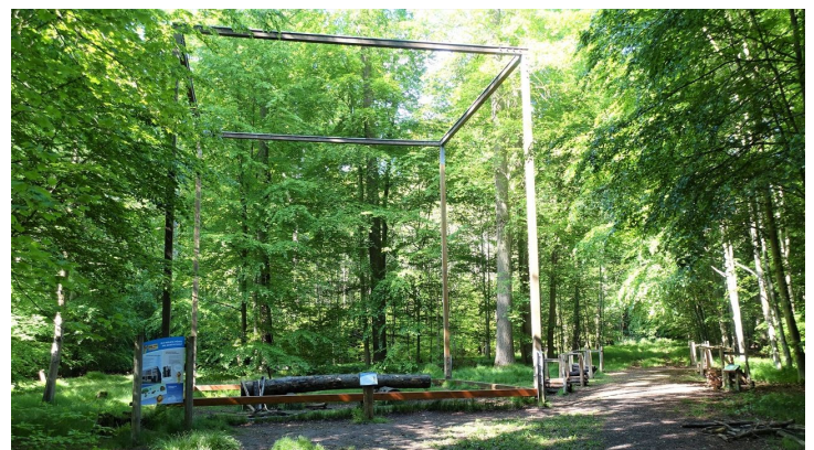
03 Station 1 - Nachhaltigkeit