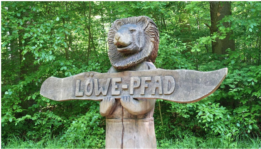
Löwe Pfad - © Thomas Kempferolte, Elm-Freizeit, Allianz für die Region GmbH