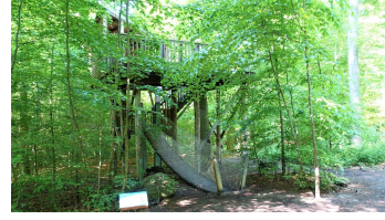
12 Löwe-Turm und Bohlenweg