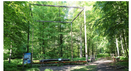
03 Station 1 - Nachhaltigkeit