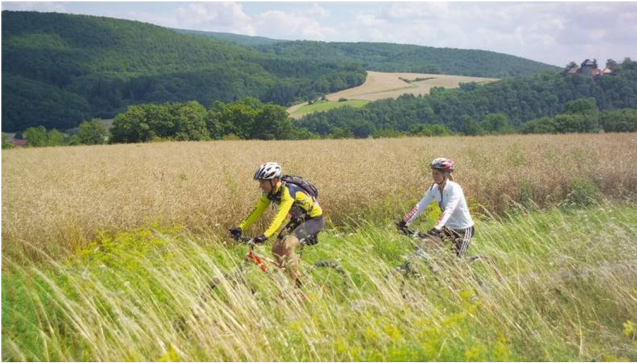
Herkules-Wartburg Radweg.JPG