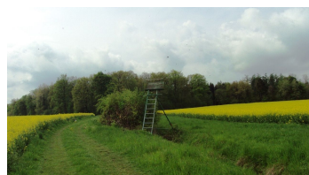
Salzgitter-Bad, Feldweg Wanderwege 12 und 18