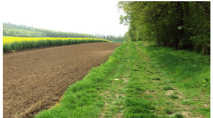
Salzgitter-Bad, Wanderweg 12 Fortlauf auf Grasweg