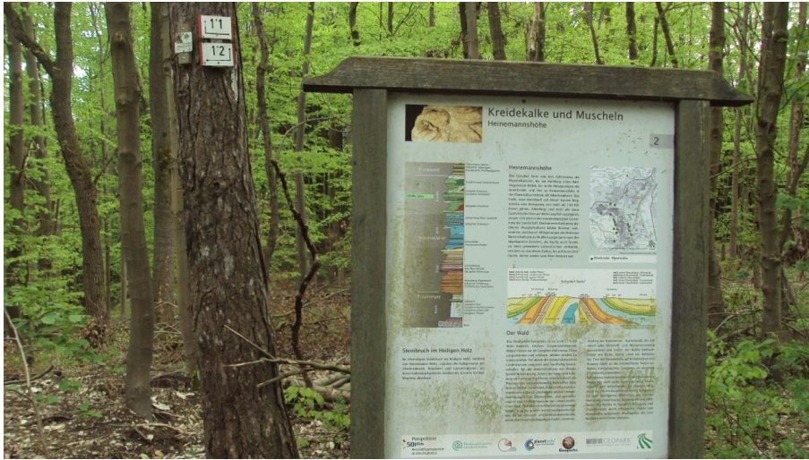
Infotafel Geopfad Salzgitter-Bad am Knotenpunkt der Wanderwege 11 und 12