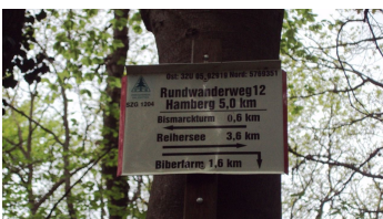
Salzgitter-Bad, Wanderweg 12 Startschild am Parkplatz beim Bismarckturm