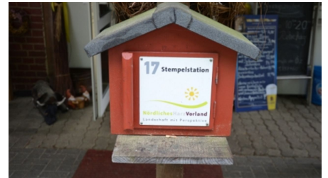
Stempelstelle 17 am Bismarckturm in Salzgitter-Bad