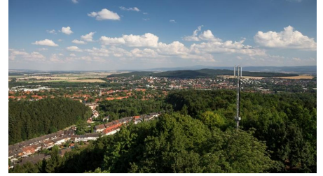
Blick vom Bismarckturm