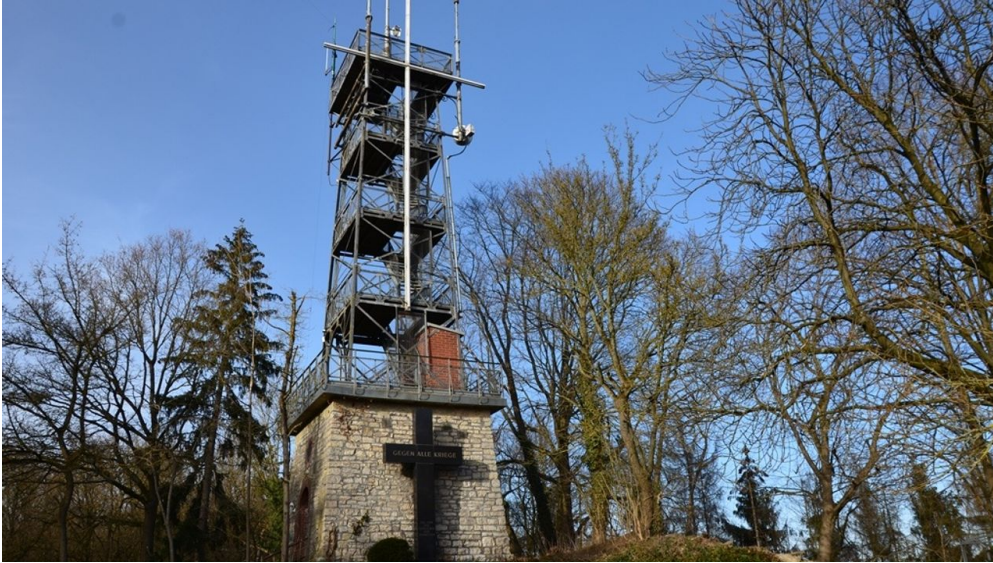
Bismarckturm Salzgitter-Bad