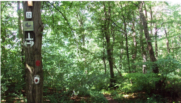
Salzgitter-Bad, Abzweigung Wanderweg 12 vom Kammweg