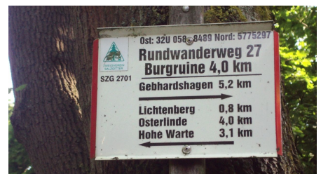
Salzgitter Höhenzug, Wanderweg 27 Startschild