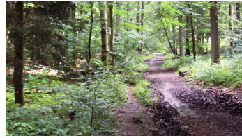
Salzgitter Höhenzug, Wanderweg 27 Aufstieg Richtung Burgruine Lichtenberg