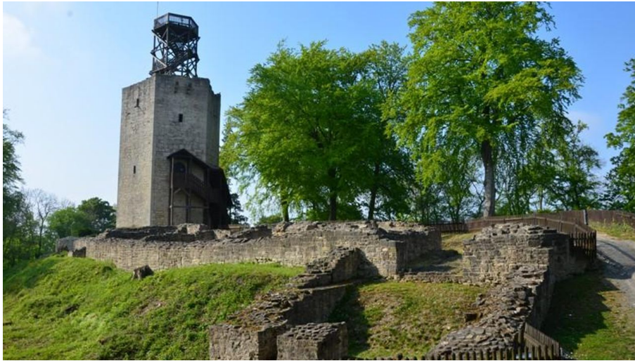
Burgruine Lichtenberg