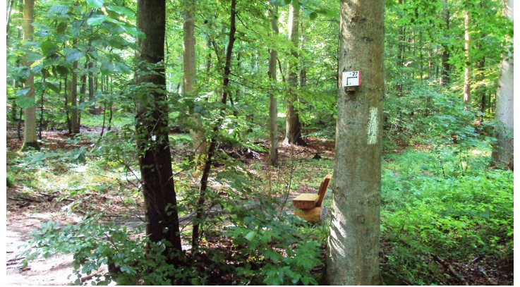
Salzgitter Höhenzug, Wanderweg 27 Wegeführung mit Rastbank