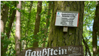
Salzgitter Höhenzug, Wanderweg 27 Abstecher zum Gaußstein