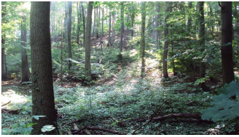
Salzgitter Höhenzug, Wanderweg 27 Waldansicht