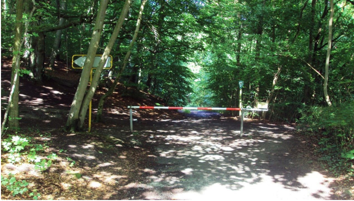
Salzgitter Höhenzug, Wanderweg 27 Waldeingang mit Schranke