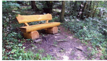
Salzgitter Höhenzug Wanderweg 27 Rastbank