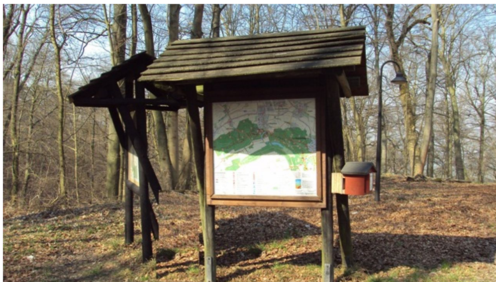
Stempelstelle 19 am Burgberg Lichtenberg

Westlich vom Burgberg erreicht man auf steilem Pfad einen trigonometrischen Punkt, den Carl Friedrich Gauß 1816 für die Landesvermessung eingerichtet hat.