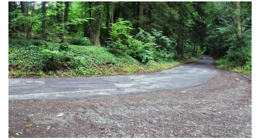
Salzgitter Höhenzug, Wanderweg 27 Waldausgang auf Zufahrtsstrasse zur Burgruine Lichtenberg