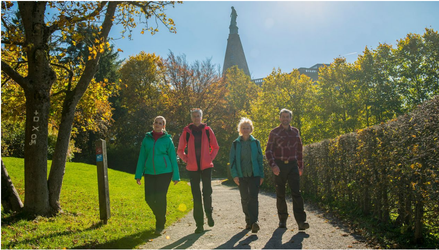
Habichtswaldsteig am Herkules.jpg