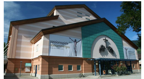
Passionstheater Oberammergau