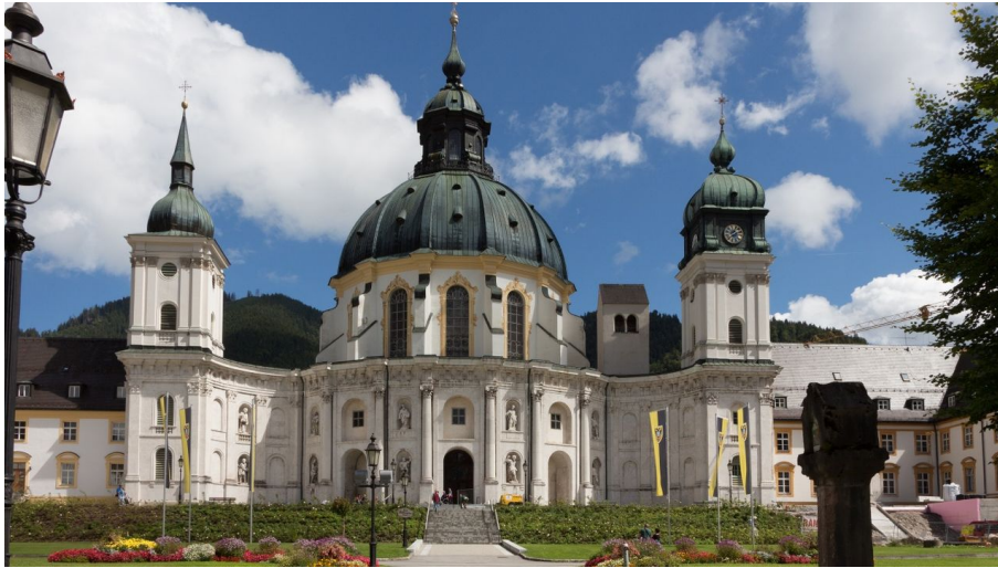
Kloster Ettal - © Ute Oberhauser, Ammergauer Alpen GmbH