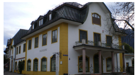
Oberammergau Museum