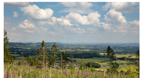
Wiehengebirge - © Oliver Krato, Lübbecke Marketing e.V.