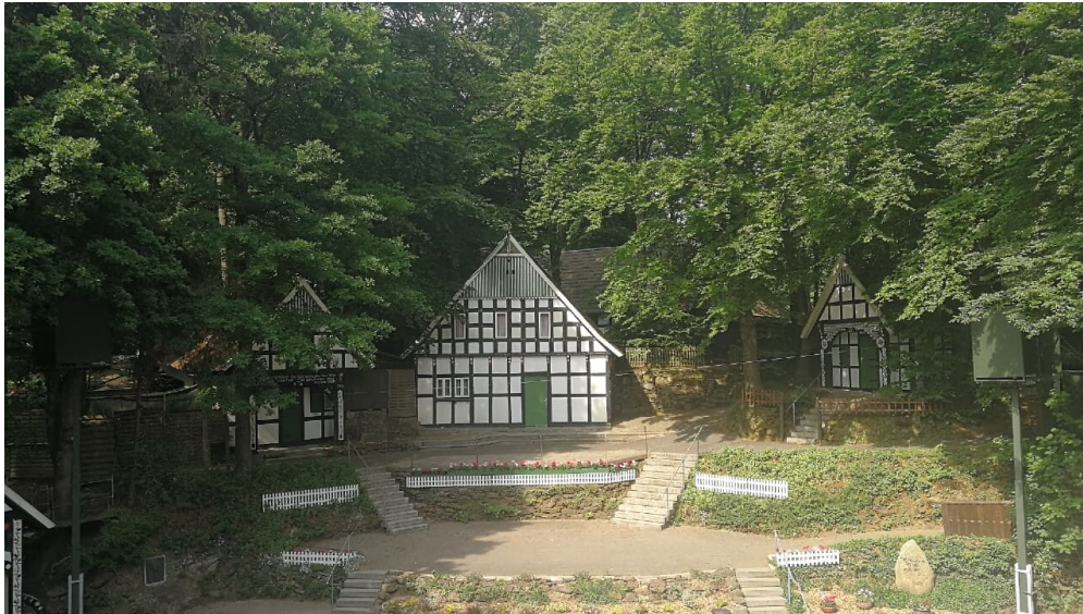
Freilichtbühne Kahle Wart, Bühne gesamt