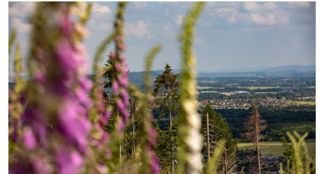
Oliver Krato, Unbekannt