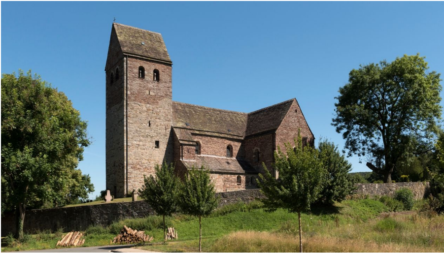
St. Kilianskirche Lügde