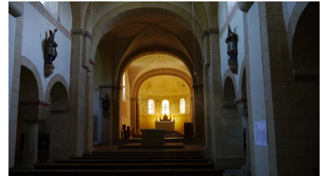
Innenansicht St. Kilianskirche