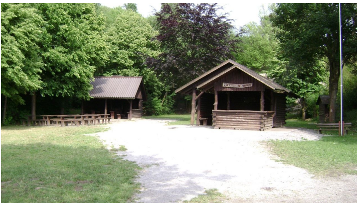
Rastplatz Kirchberghütten