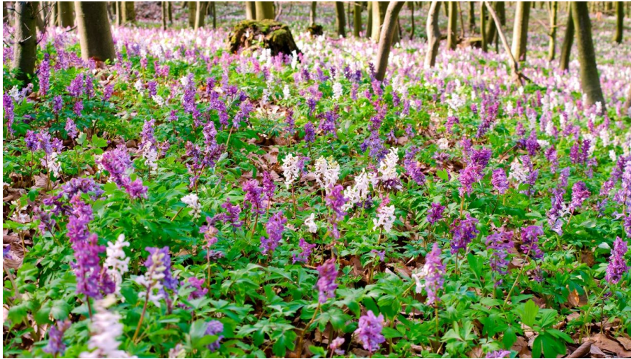
Blüte des Lerchensorns