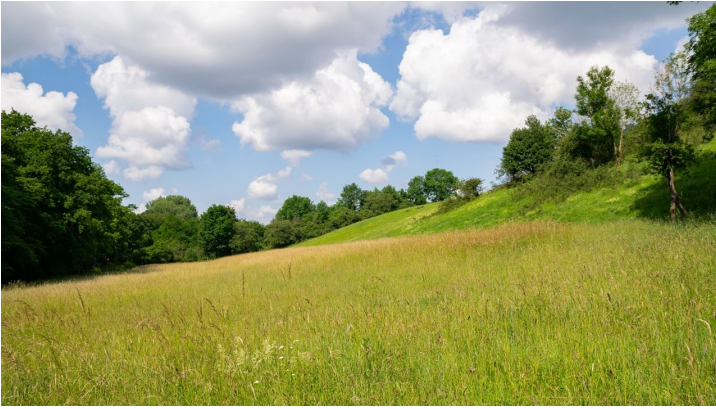
Das lange Tal - © Magnus Titho, Gemeinde Schlangen