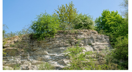
Magnus Titho, Gemeinde Schlangen