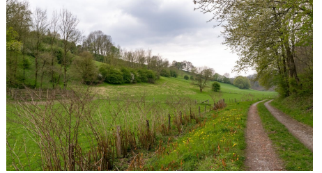
Magnus Titho, Gemeinde Schlangen