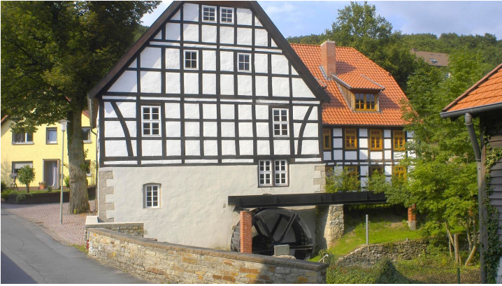
Wassermühle Starke