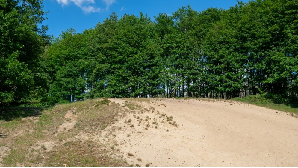
Kohlstädter Sanddüne