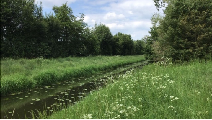
Große Aue (2).jpg