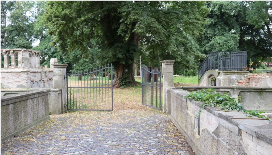
Ellerburg