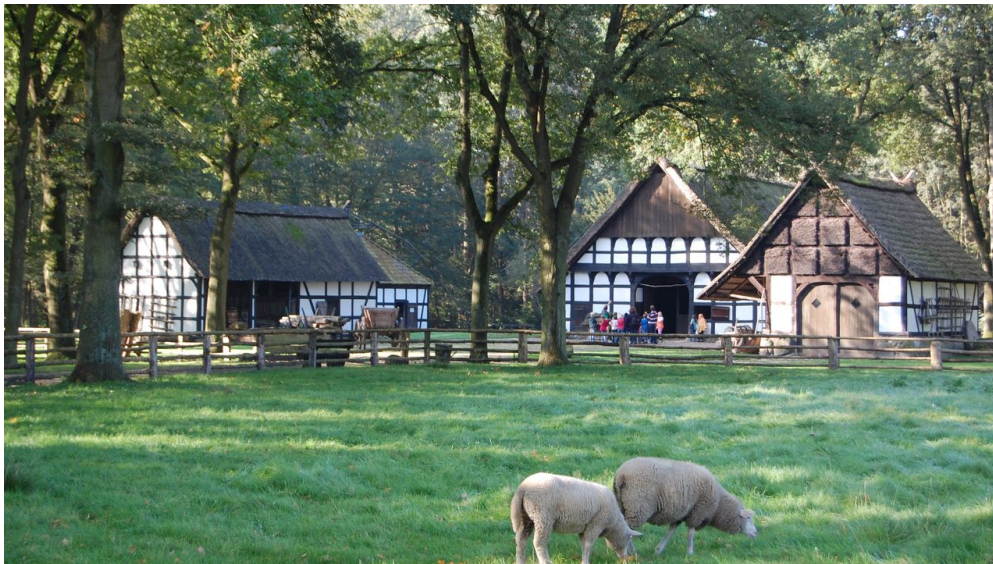
Museumshof 1.jpg