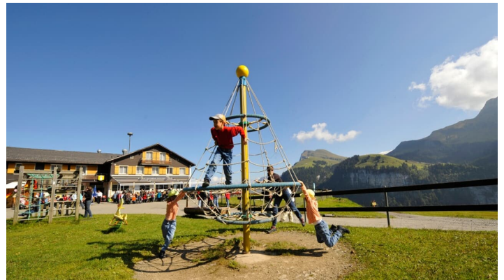
GoldiFamilien-Safari Region Klewenalp