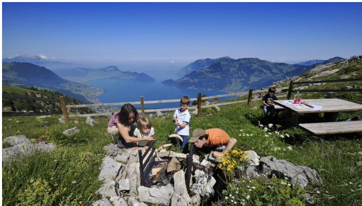
GoldiFamilien-Safari Region Klewenalp