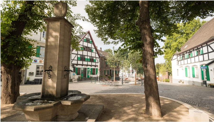
Monheimer Altstadt